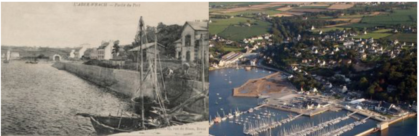
Le port de l'Aber Wrac'h du XIXème siècle à nos jours

Landéda connaît une très longue histoire maritime, qui a entraîné l'édification, au cours des siècles, de nombreux ouvrages maritimes. Des pêcheries aux viviers, des fortifications de Vauban au mur de l'Atlantique ou du port d'échouage au port de plaisance, petits ou grands, anciens et plus récents, ils ont modelé le paysage littoral et portuaire et dessinent aujourd'hui l'histoire de la commune et ses modes de vie résolument tournés vers la mer.