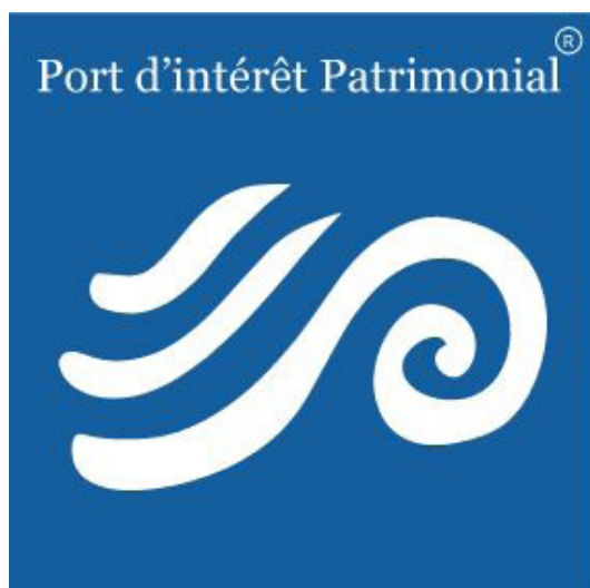
Le COPIL «Port d'intérêt patrimonial»

La municipalité s'est engagée, dès 2015 dans un travail d'Inventaire de son patrimoine maritime. En 2016, elle obtient le label « Port d'Intérêt Patrimonial », symbole de la reconnaissance du travail d'Inventaire accompli et de l'engagement de la municipalité dans un plan d'actions visant à protéger, restaurer et faire connaître son patrimoine. Pour pérenniser son engagement et poursuivre son travail, la commune de Landéda renouvelle en 2021 son label « Port d'intérêt patrimonial ».