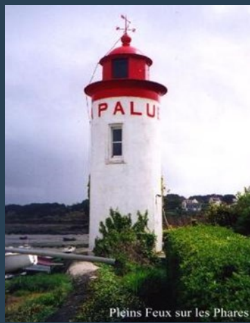
Pleins Feux sur les Phares