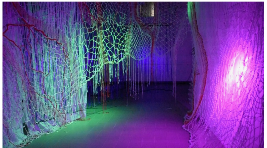
Francine Garnier / Alain Engelaere